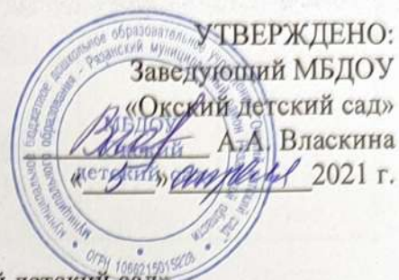
График сменности работников МБДОУ «Окский детский сад»